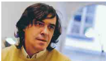
Mircea Cartarescu.